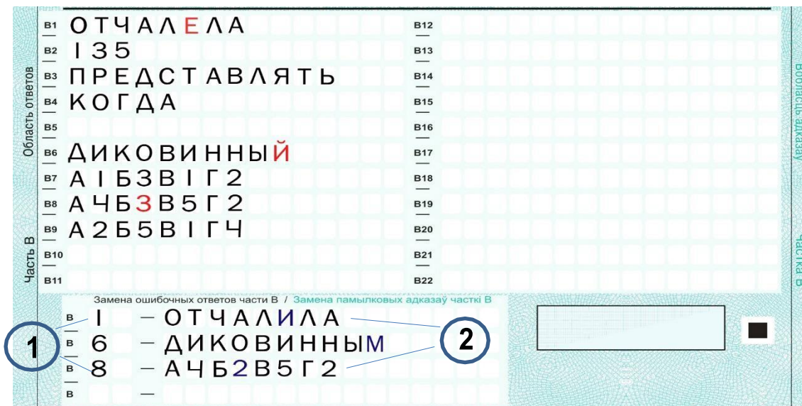
Рис. 4. Область замены ошибочных меток в части В

При проведении централизованного экзамена по иностранным языкам ответственный педагогический работник обязан сообщить участникам ЦЭ, что образцы написания латинских букв находятся в самой экзаменационной работе перед частью В.